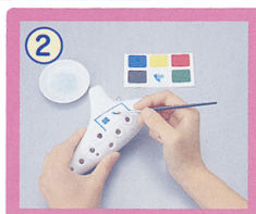
② 下書きにあわせてカラーパレットの色を塗る。