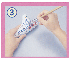
③ 乾燥後、ニスを塗る。